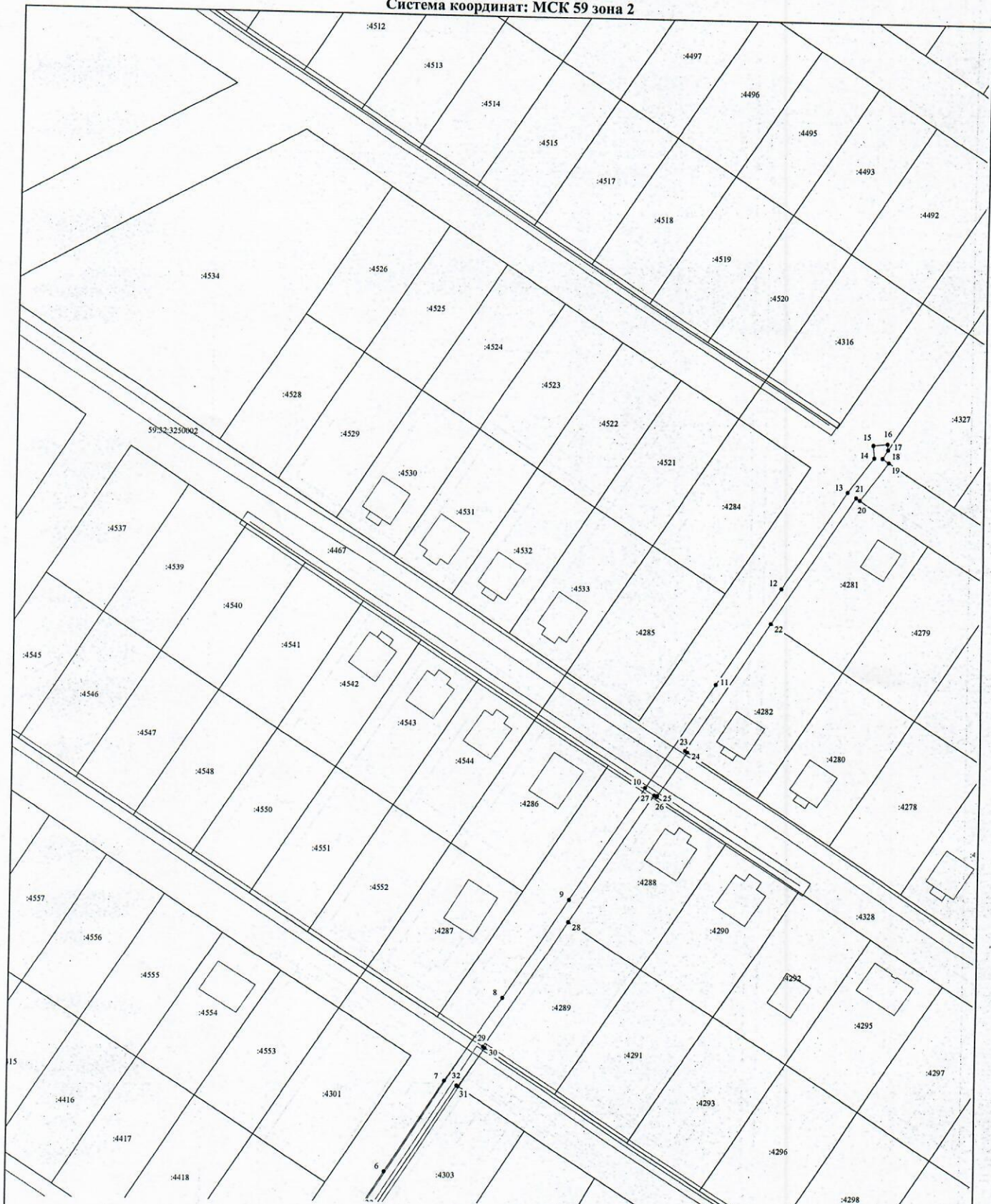
Схема предполагаемых к использованию земель или части земельного участка Система координат: МСК 59 зона 2